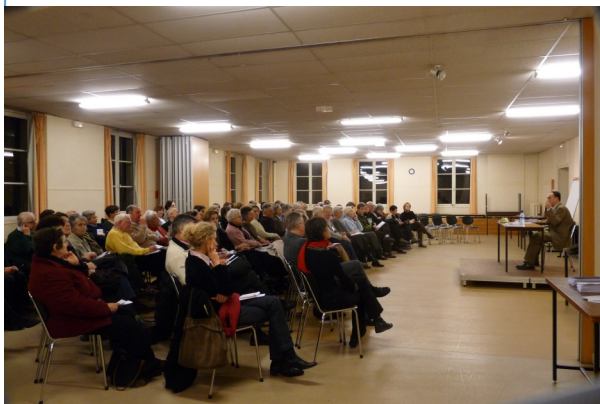
Une belle salle

Le cycle de conférences organisé par l'ASP-Yvelines les 10 février, 3 et 24 mars a rencontré un