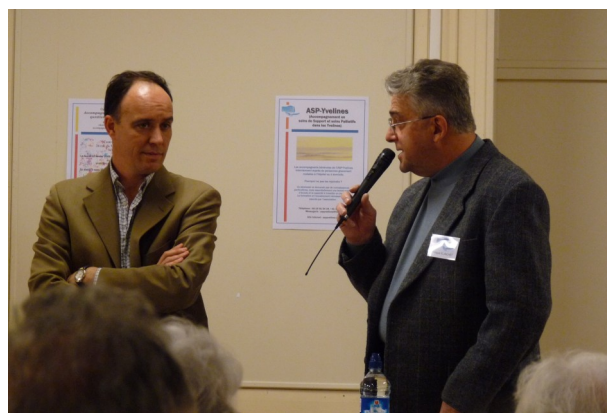
Notre président dans le rôle de l'interviewer

à faire » se pose de façon lancinante ; les souffrances et les besoins du malade le long de la maladie demandent bien sûr des réponses, des gestes, des actes thérapeutiques, mais aussi des réponses, des gestes, des actes d'humanité, de solidarité, de fraternité. C'est à ce moment que l'accompagnement, affaire de tous et de chacun, peut trouver sa place..et bien souvent le malade veut bien nous accorder cette petite place, en plus, en complément, des places déjà occupées par les soignants, les proches, les amis...ou peut être aussi, plus simplement, nous accepter et nous reconnaître « comme son frère en humanité ».